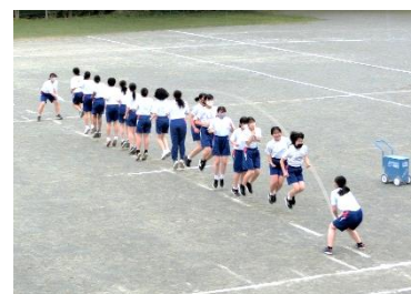
2年大縄跳び 全員で気持ちを一つにして