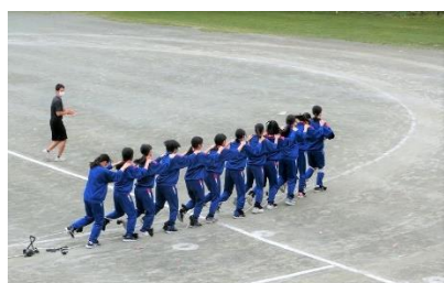
3年大ムカデ 練習を重ねるごとに速度が上がる

その成果が体育大会当日大いに発揮され、南中生一人ひとりが持てる力を最大限に出し輝けるように、残り時間も精一杯準備を進めていきたいと思ひます。