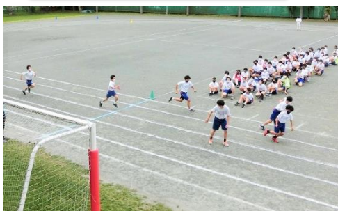
全員リレー バトンを繋いでゴールを目指す