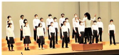
府中の森芸術劇場 どりーむホール 10月15日